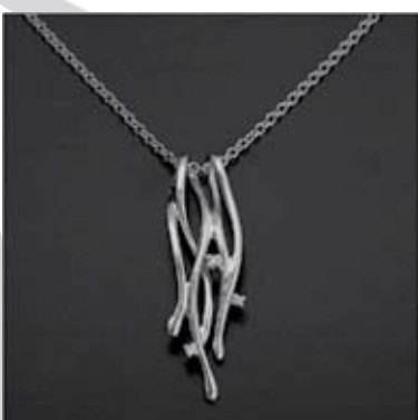
Art.: 11022168 Obesek iz zlata z briljanti verižica ni vključena v ceno cena: 299 €