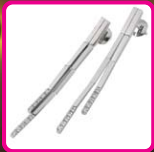
uhani belo zlato z briljanti 11033403 - cena 859 EUR