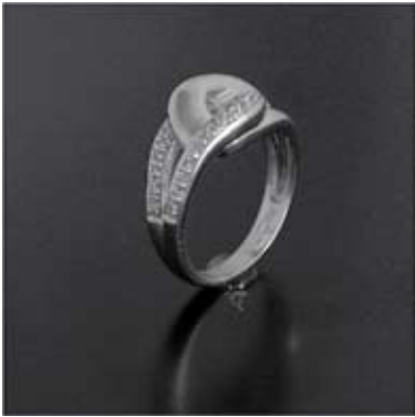
Art.: 11014588 Prstan iz zlata s cirkoni cena: 290 €