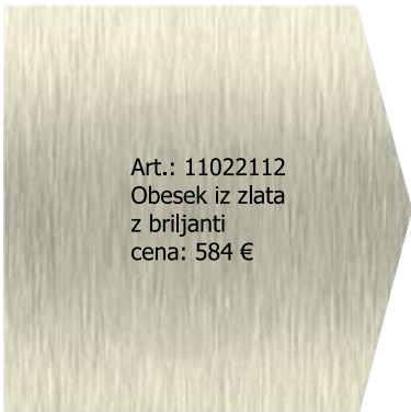
Art.: 11022112 Obesek iz zlata z briljanti cena: 584 €