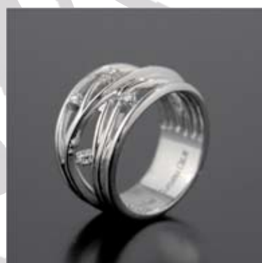
Art.: 11014583 Prstan iz zlata z briljanti cena: 549 €