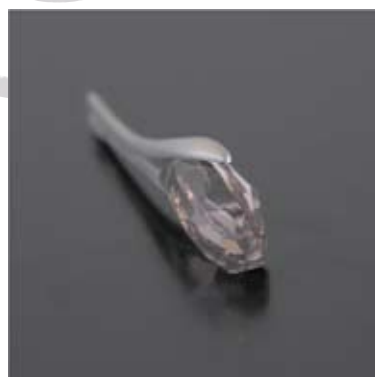
Art.: 52020077 Obesek iz srebra s Swarovski kristalom cena: 29 €