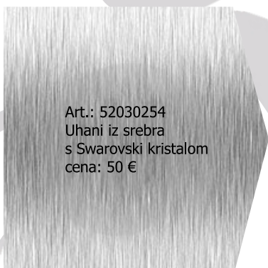
Art.: 52030254 Uhani iz srebra s Swarovski kristalom cena: 50 €