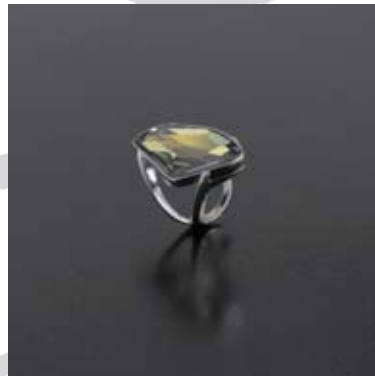
Art.: 52010333 Prstan iz srebra s Swarovski kristalom cena: 91 €