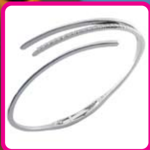
zapestnica belo zlato z briljanti 11052625 - cena 1408 EUR