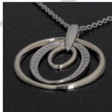
Art.: 11022166 Obesek iz zlata s cirkoni verižica ni vključena v ceno cena: 256 €