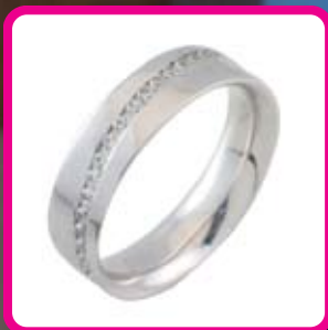
prstan belo zlato z briljanti 11014490 - cena 726 EUR