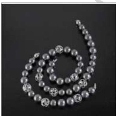
Art.: 52050060 Art.: 52080433 Zapestnica in ovratnica iz srebra s Swarovski biserom cena: 89 € cena: 149 €