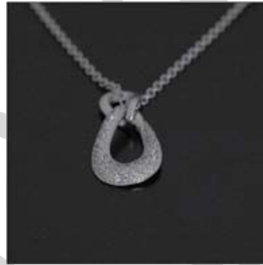
Art.: 11022177 Obesek iz zlata s cirkoni verižica ni vključena v ceno cena: 199 €