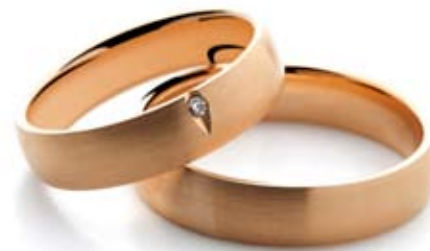
moški prstan 11018529M-cena 439 EUR ženski prstan z briljantom 11018528M-cena 481 EUR

Celotna kolekcija na www.zlatarnacelje.si