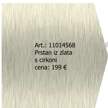
Art.: 11014568 Prstan iz zlata s cirkoni cena: 199 €