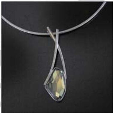
Art.: 52080432 Ovratnica iz srebra s Swarovski kristalom cena: 97 €