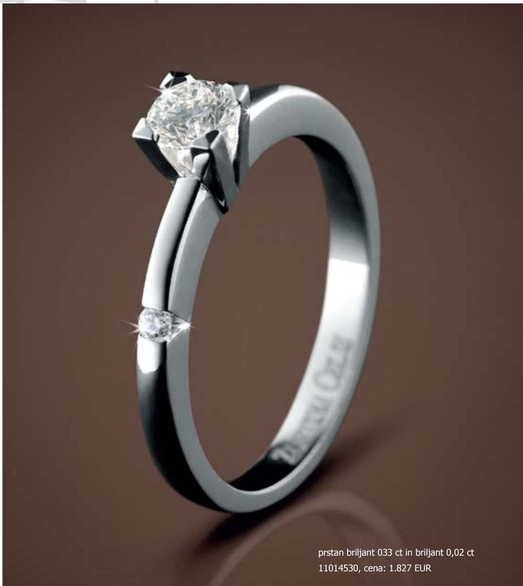
prstan briljant 033 ct in briljant 0,02 ct 11014530, cena: 1.827 EUR

pripravila: Nika Škoberne