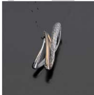
Art.: 11014455 Prstan iz zlata z briljanti cena: 814 €