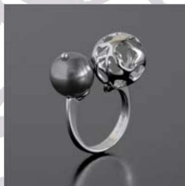
Art.: 52010334 Prstan iz srebra s Swarovski biserom cena: 54 €