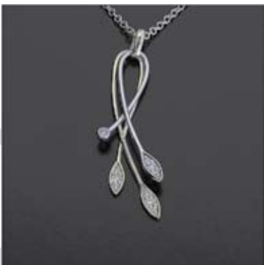
Art.: 11022167 Obesek iz zlata s cirkoni verižica ni vključena v ceno cena: 160 €