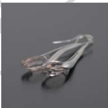
Art.: 52030249 Uhani iz srebra s Swarovski kristalom cena: 77 €