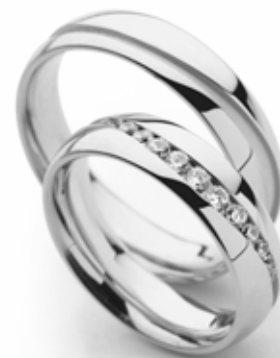
moški prstan 11014556-cena 371 EUR ženski prstan z briljanti 11014555-cena 698 EUR