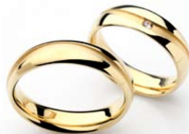
moški prstan 11014556-cena 371 EUR ženski prstan z briljantom 11014557-cena 421 EUR