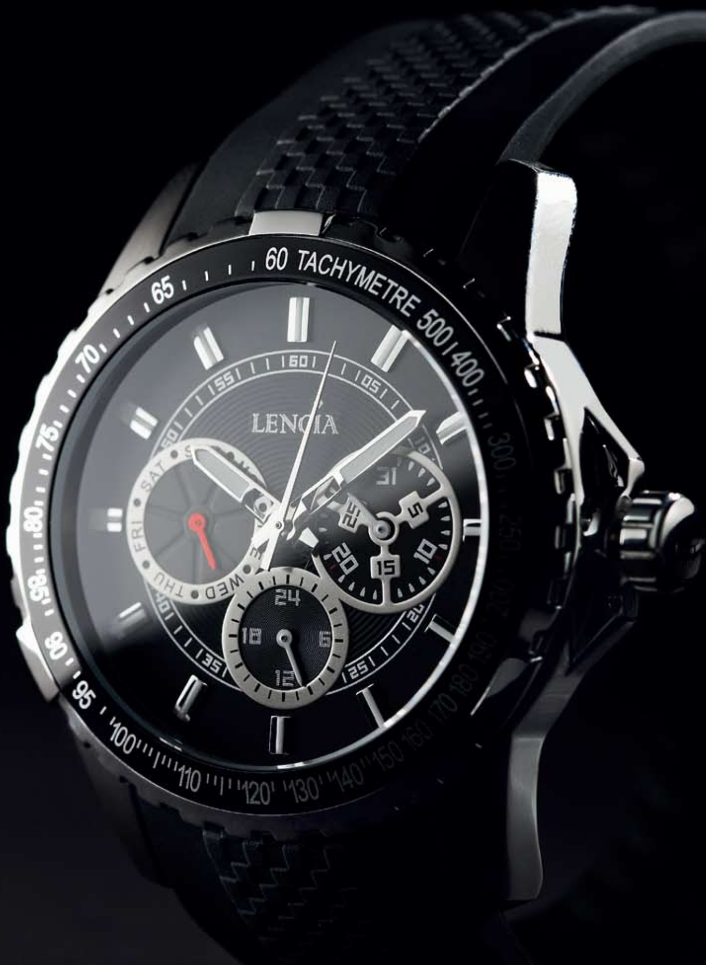
Moška ura Lencia model L015, cena: 99 EUR