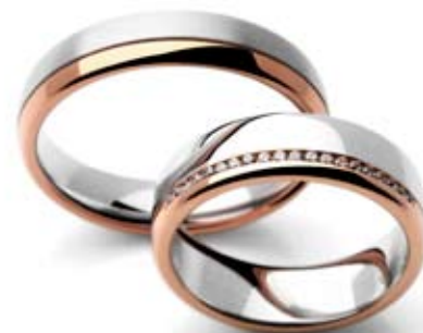
moški prstan 11018523-cena 705 EUR ženski prstan z briljanti 11018522-cena 1.068 EUR